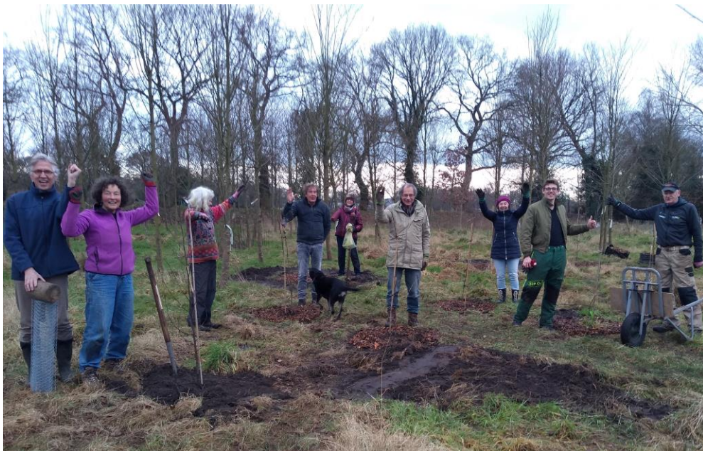
Foto: 35 jonge boompjes geplant in het lindebos, acacia en els voor het verbeteren van de grond

Als Voedselbos te Glimmen zijn we lid geworden van Impact Noord, een netwerk van bedrijven in de Noordelijke provincies die maatschappelijke impact nastreven. Omdat we in Voedselbos te Glimmen ook een sociale functie willen hebben, zijn we met de Gemeente Groningen in overleg over participatiebanen. Het zou mooi zijn als we in onze vrijwilligersgroep, waarin ook een aantal coaches rondlopen, ook een warme sociale omgeving kunnen zijn waarin kwetsbare mensen mee kunnen doen.