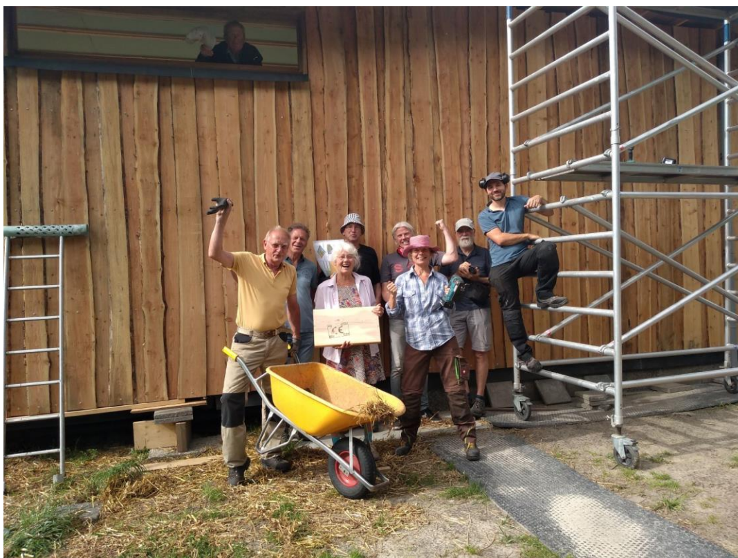
Foto: juni 2022-het bouwteam rond de eerste fase af, met de eerste twee één-uit-duizend-donateurs in het midden